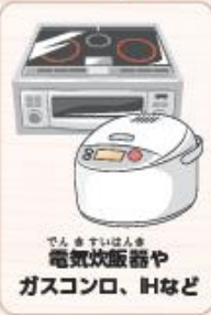
電気炊飯器やガスコンロ、IHなど