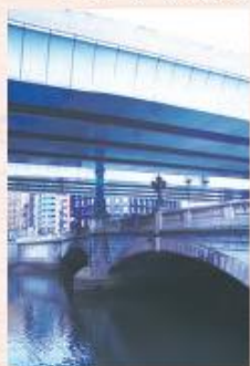
上は高速道路。下の橋が日本橋です。

下の写真は今の日本橋です。昔の日本橋とどんなところが違いますか？気づいたことを書いてみましょう。