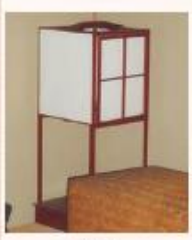
行灯 [明るくする] ための道具