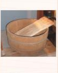
洗濯板、たらい [衣服を洗う] ための道具