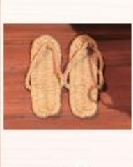
わら草履 [外を歩く] ための道具