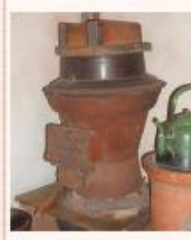
かまど、かま [食べ物にる] ための道具