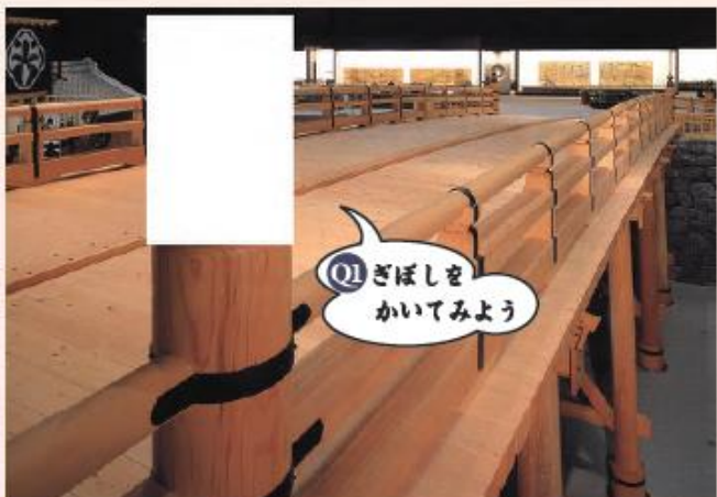
マップ A (日本橋)

江戸東京博物館の常設展示室に入るとすぐに、とても大きな橋がかかっています。これは、江戸時代（1603〜1868年）につくられた日本橋という橋を、長さを半分にして再現したものです。