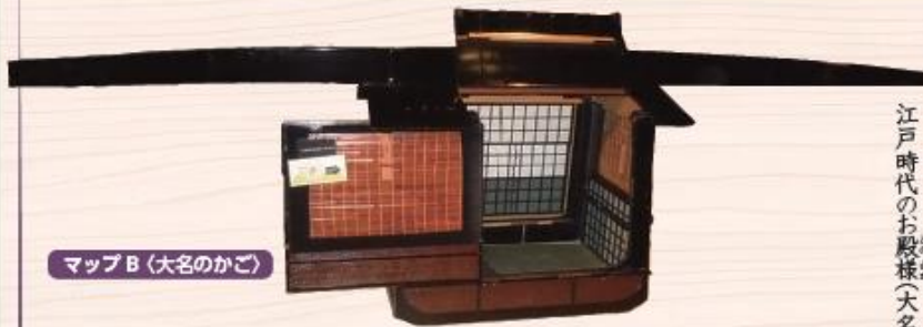
マップB (大名のかご)