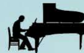
新垣隆 (作曲家/ピアニスト)

1970年東京都出身。4歳よりピアノを始める。桐朋学園大学音楽学部作曲科卒業。作曲を南聡、中川俊郎、三善晃、ピアノを森安耀子の各氏に師事。2015年「ピアノ協奏曲新生」、2016年「交響曲連祷 Litany」を発表。コンサートのための作品、バレエ、映画、ゲームなど様々なジャンルの作曲も手がける。川谷絵音プロデュースのバンド「ジュニーハイ」にキーボードとして参加。桐朋学園講師、富山桐朋学園大学院大学特任教授に就任。現在、大阪音楽大学客員教授に在職中。日本現代音楽協会、日本演奏連盟会員。